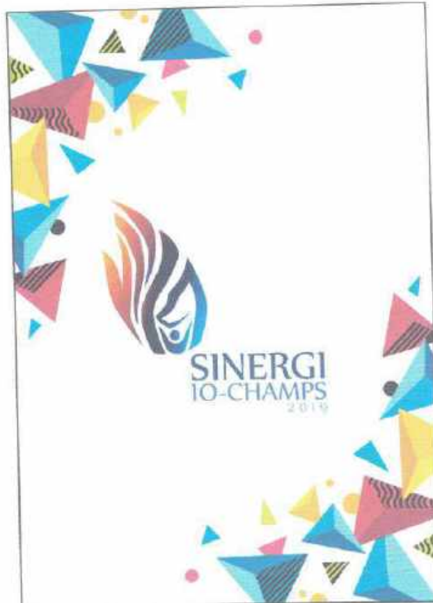
Cover Halaman Depan

Handbook Peserta kegiatan Informasi dan Orientasi Mahasiswa Baru Universitas Internasional Semen Indonesia Tahun 2019 (IO-CHAMPS SINERGI UISI 2019)