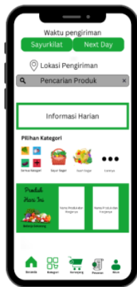
Gambar 2. Tampilan untuk sistem penjualan online

siapa pun itu, namun diberikan jangkauan lokasinya agar tidak terlalu jauh pelanggannya. Diberikan jangkauan lokasi bertujuan untuk mengurangi biaya pengiriman produk dan juga untuk menghindari kerusakan produk di perjalanan. Karena mengingat sayur merupakan tanaman yang mudah rusak jika tidak dilakukan penanganan yang baik. Dalam membuat sistem penjualan melalui online, langkah pertama yang dapat dilakukan adalah mengetahui terlebih dahulu apa tujuan dari pembuatan sistem tersebut, kemudian dilakukan pengonsepan secara matang mengenai sistem yang diinginkan, kemudian barulah mengembangkan sistem sesuai dengan konsep yang sudah matang. Untuk sistem yang dibuat, harus disesuaikan dengan kebutuhan pelanggan namun tidak merugikan petani. Salah satu contohnya yaitu, dengan melakukan pembatasan waktu pembayaran. Dengan itu pesanan pelanggan tidak akan diproses sebelum pembayaran dilakukan.