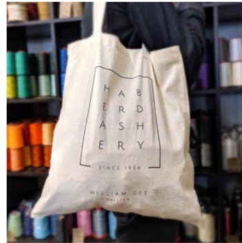
Gambar 4. Gambar contoh kantong belanja

Pemilihan jenis kemasan untuk produk urban farming ini lebih banyak ditentukan oleh preferensi konsumen yang semakin tinggi tuntutan. Misalnya, dengan mengubah kemasan plastik menjadi plastik yang berasal dari singkong yang lebih mudah terurai. Dan untuk pelanggan yang membeli tanaman ke petani, sebaiknya petani menerapkan aturan bahwa pelanggan yang ingin membeli tanaman hasil urban farming dihibau untuk membawa kantong belanja sendiri yang tidak berasal dari plastic seperti pada Gambar 4.