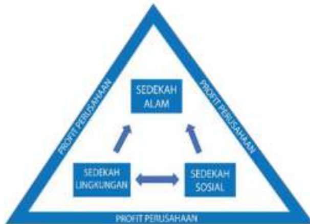
Konsep Sedekah Triple Bottom Line